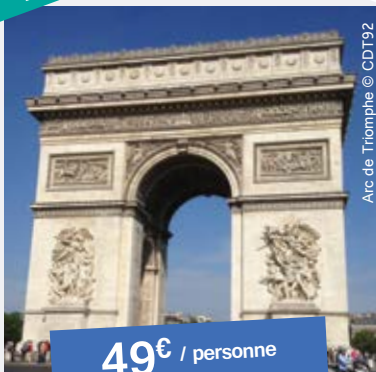
Arc de Triomphe