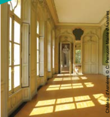
Château d'Asnières