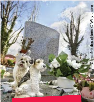
Cimetière des chiens