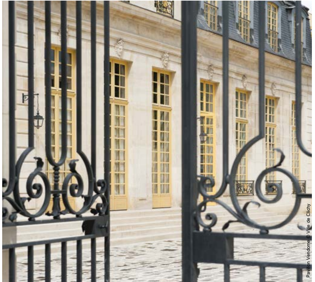
Pavillon Vendôme © Ville de Clichy

11h00 ➤ A Clichy, découverte du pavillon Vendôme , ancien pavillon de chasse seigneurial du XVII ème siècle, entièrement restauré et transformé en Centre d'art contemporain. Une élégante architecture classique, un décor de stucs dorés du salon d'honneur, signé des plus grands ornemanistes de l'époque, dialoguent avec des espaces contemporains et une réinterprétation du jardin à la française. Cette visite offre une interaction fascinante entre l'histoire et la modernité.